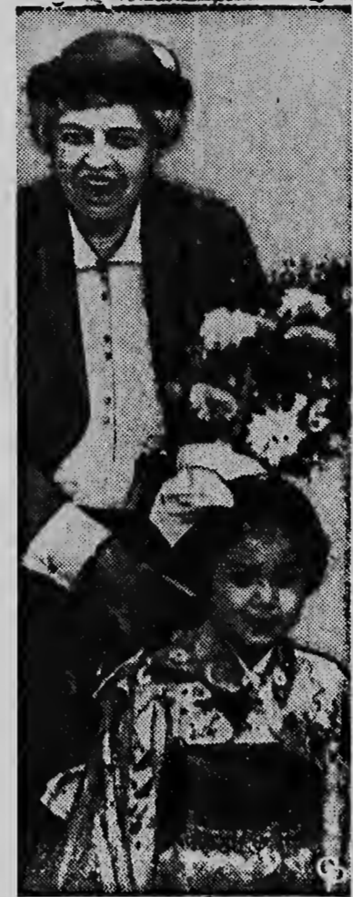
MEVROUW ELEANOR Roosevelt glimlacht bij haar aankomst in Tokio, waar haar door een klein Japan meisje een bouquet wordt aangeboden. Mevrouw Roosevelt vertoefte in Japan op uitnodiging van het Japanse eomlte voor culturele uitwisseling.

Bij de uitvoering van het Tienjarenplan zal men nu enerzijds trachten de arbeidsdiscipline en arbeidsproductiviteit o.a. door vakonderwijs en culturele vorming te